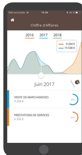
Aperçu en version mobile